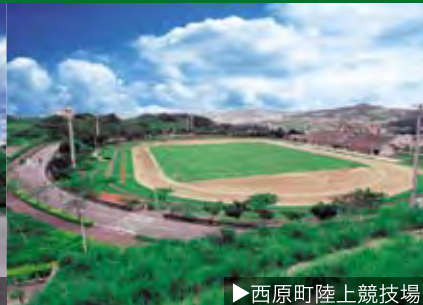
▶西原町陸上競技場